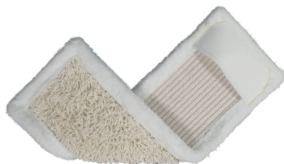
Spezielles Deckblatt 50/50