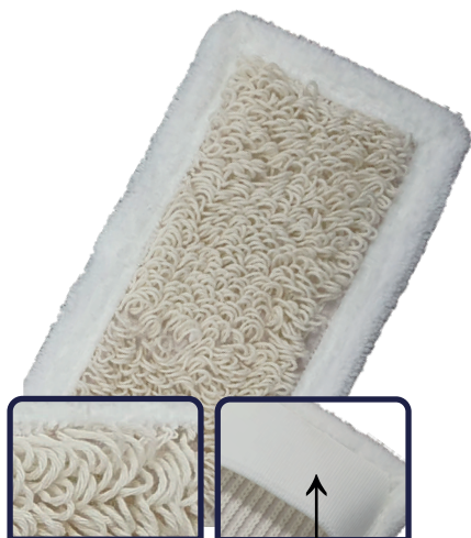
Taschen speziell gewebt aus Polyester mit Verstärkung