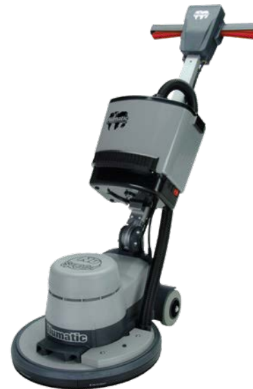
Abb. mit optionaler Absaugung

606079 Absaug-/ Spritzschutzring mit Bürststreifen, 450 mm