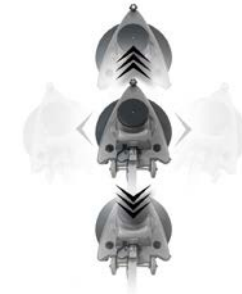
Drei Laufräder für gute Manövrierbarkeit