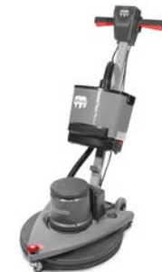
Optionale Absaugung erhältlich